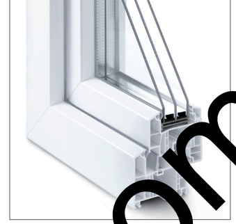
GENEO® destek sacsız